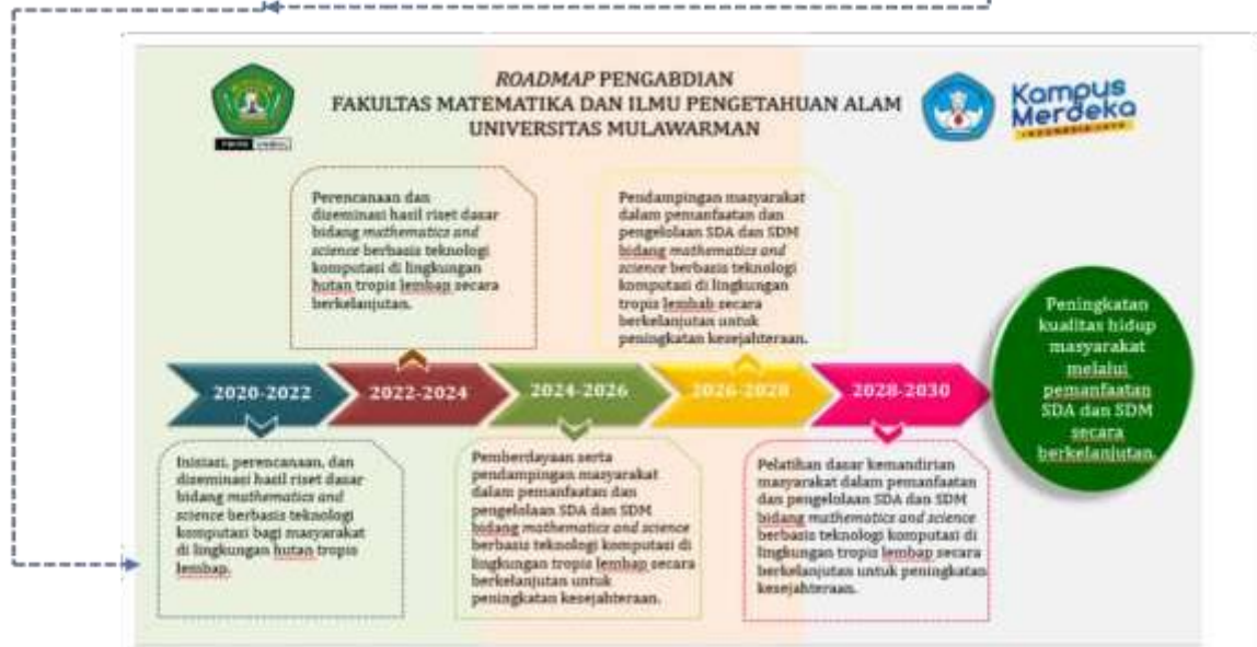
Gambar 2.1 Prioritas PkM dan Roadmap Penelitian FMIPA Universitas Mulawarman