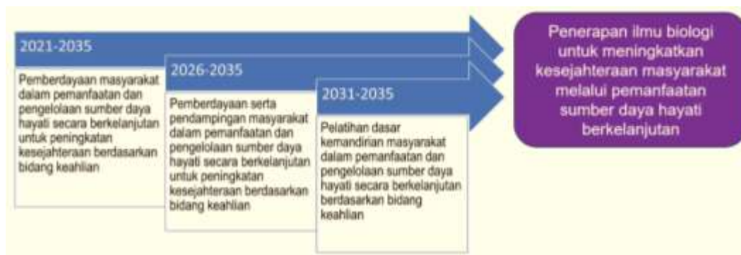
Gambar 2.2 Roadmap PkM PS S1 Biologi

Tema PkM yang dilaksanakan oleh dosen PS S1 Biologi selama tahun 2021 disajikan pada tabel 2.1. Pelaksanaan kegiatan PkM tersebut umumnya berkaitan dengan roadmap PkM PS S1 Biologi tahun 2021-2035 yaitu pemberdayaan masyarakat dalam pemanfaatan dan pengelolaan sumber daya hayati secara berkelanjutan untuk peningkatan kesejahteraan berdasarkan bidang keahlian.