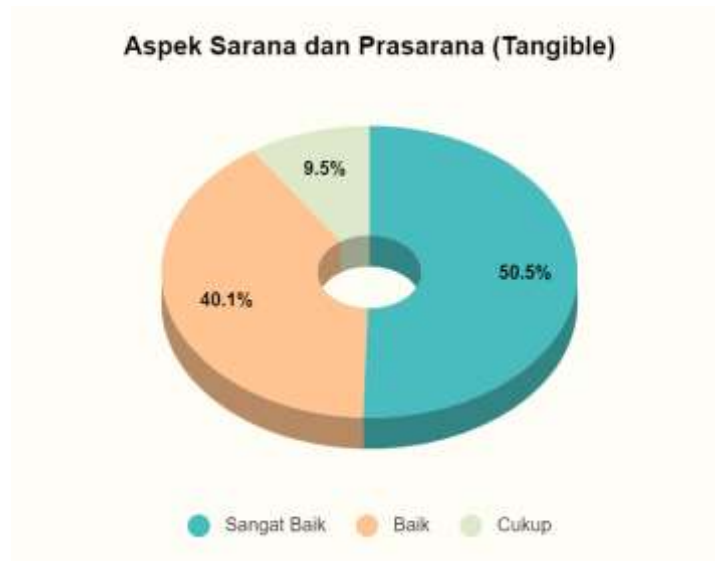
Gambar 5. Tingkat Kepuasan Mahasiswa terhadap Aspek Tangible

Berdasarkan Gambar 5, pada tahun 2020, 50,5% mahasiswa menilai kecukupan, aksesibilitas, serta kualitas sarana dan prasarana selama proses pendidikan adalah sangat baik, sementara 40,1% menilai baik. Di tahun 2020, 9,5% mahasiswa menilai aspek-aspek tersebut sebagai cukup. Tingkat kepuasan mahasiswa untuk aspek tangible, yaitu penilaian terhadap kecukupan, aksesibilitas, serta kualitas sarana dan prasarana selama proses pendidikan pada tahun 2020, mencapai 80,35%, yang termasuk dalam kategori sangat baik.