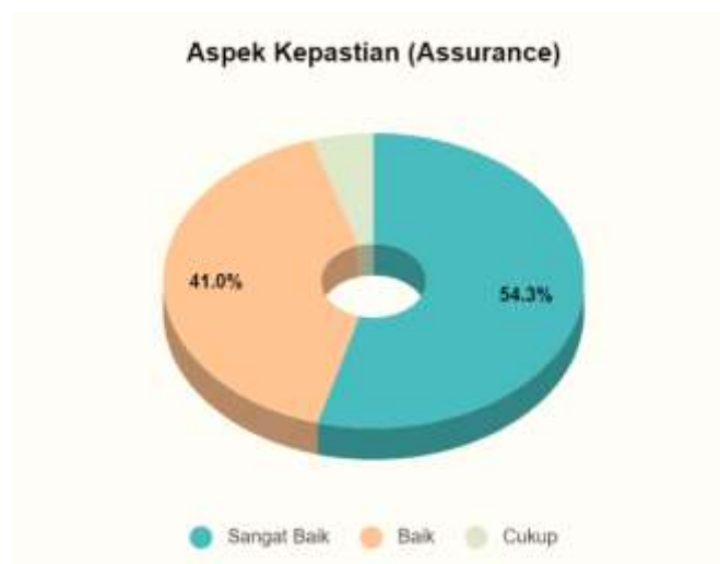
Gambar 3. Tingkat Kepuasan Mahasiswa terhadap Aspek Kepastian (Assurance)

Pada aspek kepastian ( assurance ), mahasiswa memberikan penilaian terhadap kemampuan dosen, tenaga kependidikan, dan pengelola untuk memberi keyakinan kepada mahasiswa bahwa pelayanan yang diberikan telah sesuai dengan ketentuan selama proses pendidikan berlangsung pada tahun 2020. Tingkat kepuasan mahasiswa pada aspek kepastian ( assurance ) disajikan pada Gambar 3.