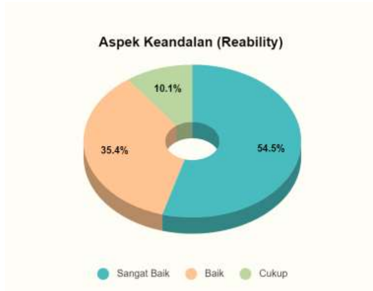
Gambar 1. Tingkat Kepuasan Mahasiswa terhadap Aspek Keandalan ( Reliability )

Pada aspek keandalan ( reliability ), mahasiswa memberikan penilaian terhadap kemampuan dosen, tenaga kependidikan, dan pengelola dalam memberikan pelayanan selama proses pendidikan berlangsung pada tahun 2020. Tingkat kepuasan mahasiswa pada aspek keandalan ( reliability ) disajikan pada Gambar 1.